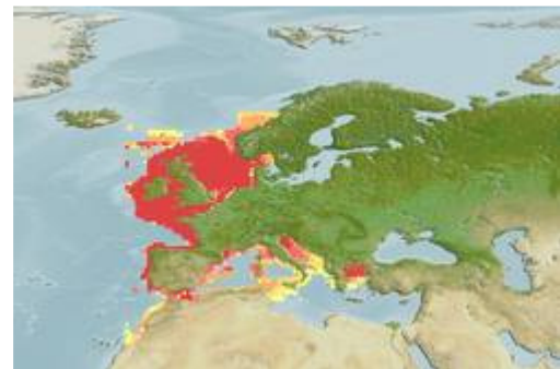
Útbreiðsla av glýsufiski. Í ein útnyrðing er Føroyabanki markið.