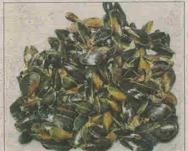
Um nækur ár kann kræklingur kanska gerast ein týðandi vinna í Føroyum

Deyðilíghheitin hjá kræklingarvunum er vanligast stór, og bert umleið 1% av teimum gýttu larvunum yvirliva og kunna festa seg á eitt fast undirlag. Men eisini her eru nógvir figgindar. Kræklingur er føði hjá fleiri dýrum, sum liva í sjónum, bæði hjá teimum, sum liva á botni og hjá fugli, sum kavar eftir kræklingi ella tekur hann í fjøruni. Æða og tjöldur eru tey fuglaslagini, sum eta mest av kræklingi. Kanningar í Vaðhavinum í Danmark vísa, at av teimum 3 milliónum kg av føði, sum æðurnar ótu um árið, vóru 1,2 milliónir kg kræklingur. Tjöldur ótu 2 milliónir kg um árið. Ein fjórðingur av hesum var kræklingur. Tá æðurnar eta krækling, svølgja tær hann heilan, síðan verður hann knústur